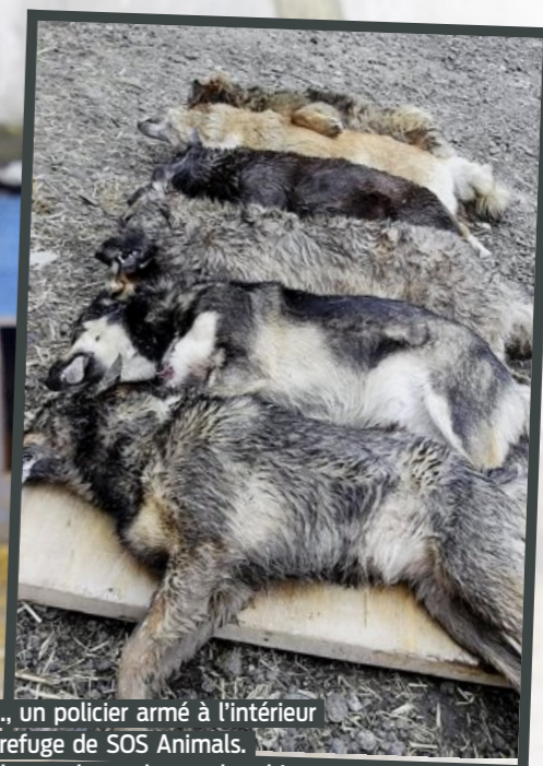
A g., un policier armé à l'intérieur du refuge de SOS Animals. Ci-dessus: les cadavres des chiens empoisonnés par les «dog hunters».

● VICTOR FINGAL victor.fingal@lematin.ch